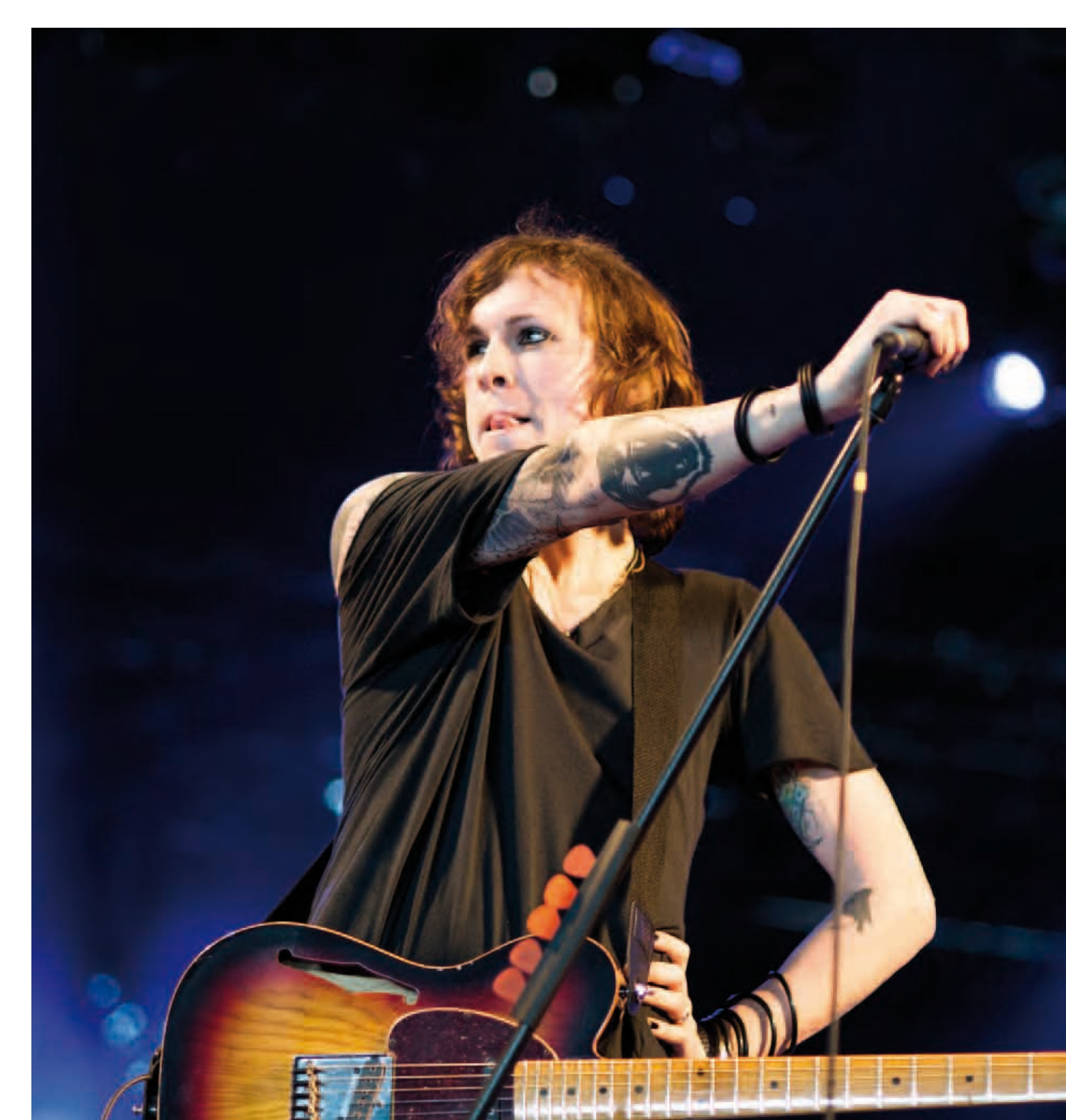
Laura Jane Grace (Against Me!) auf dem Dour Festival 2012, Foto: Kmeron, Quelle: flickr.com, CC BY-NC-ND 2.0