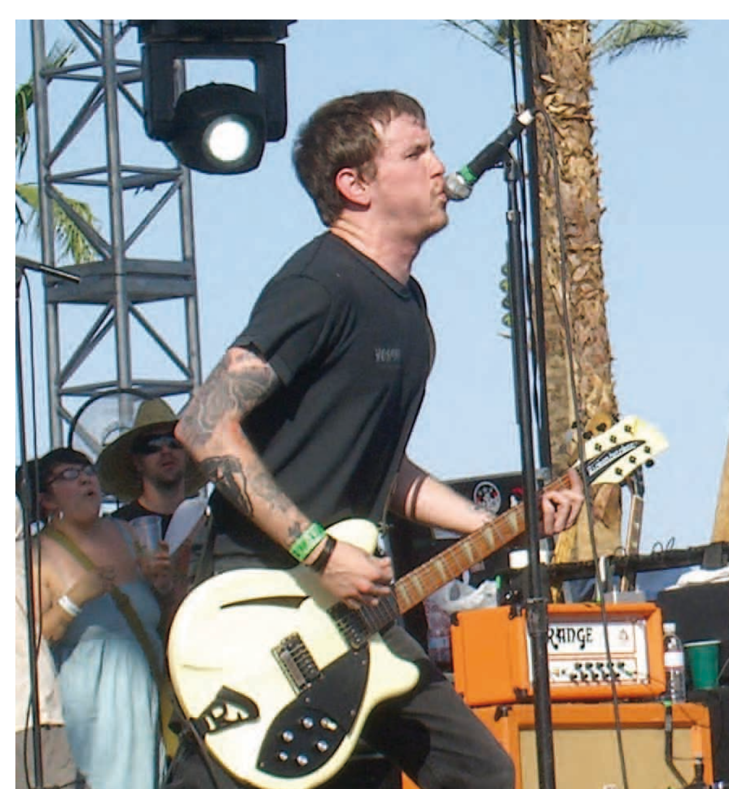
Tom Gabel (Against Me!) auf dem Coachella Valley Music and Arts Festival 2007