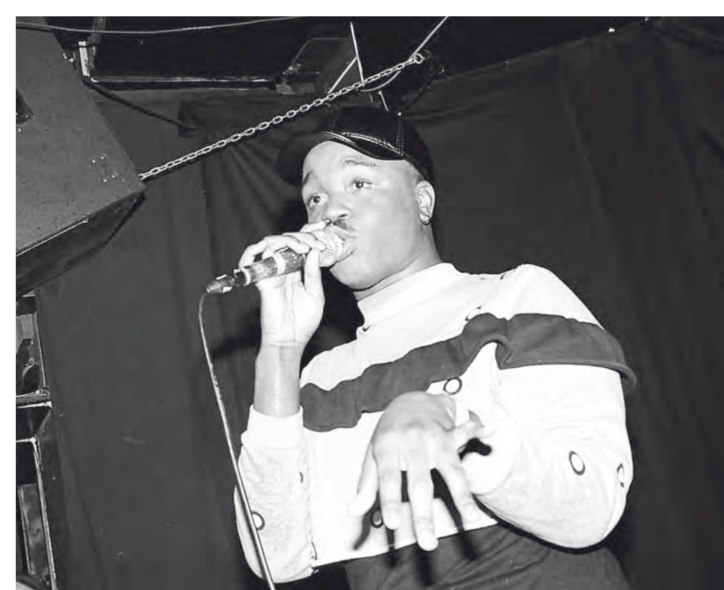
Rashard Bradshaw alias Cakes da Killa 2017

Die Kampagne und der HipHop-Sampler ›Make some Noise‹ des Berliner Labels Springstoff setzen ebenfalls ein Zeichen gegen Sexismus, Homo- und Transfeindlichkeit.